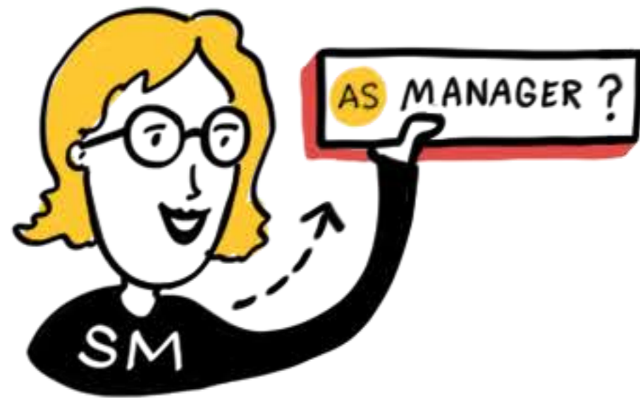
マネージャー スクラムマスター?