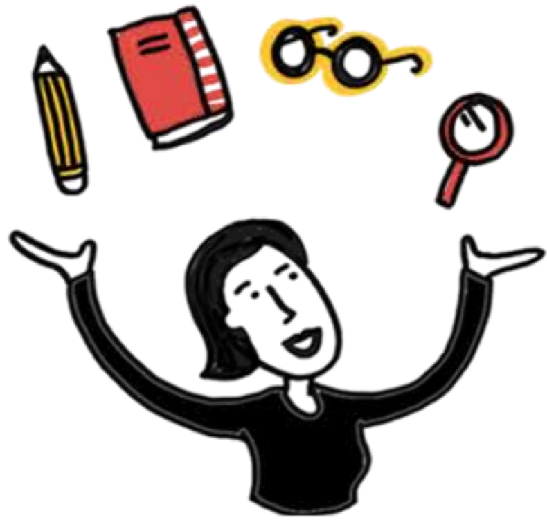
マネージャーの役割